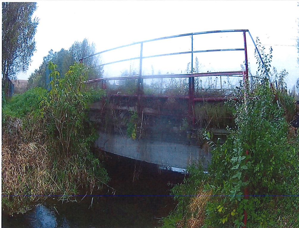
Fot. 3. Widok boczny na obiekt