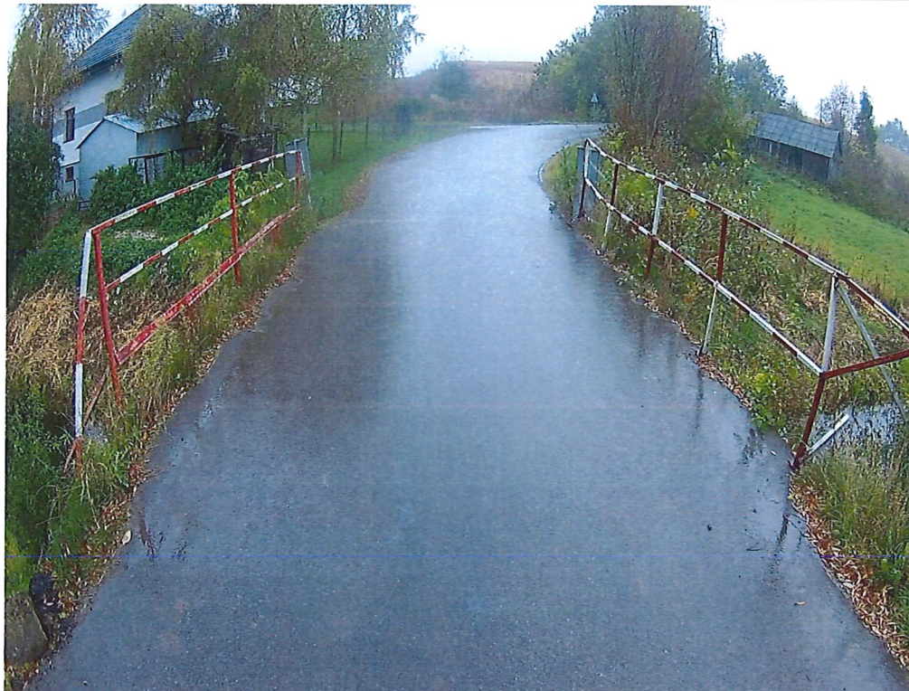
Fot. 1. Widok ogólny na most i na nawierzchnię jezdni