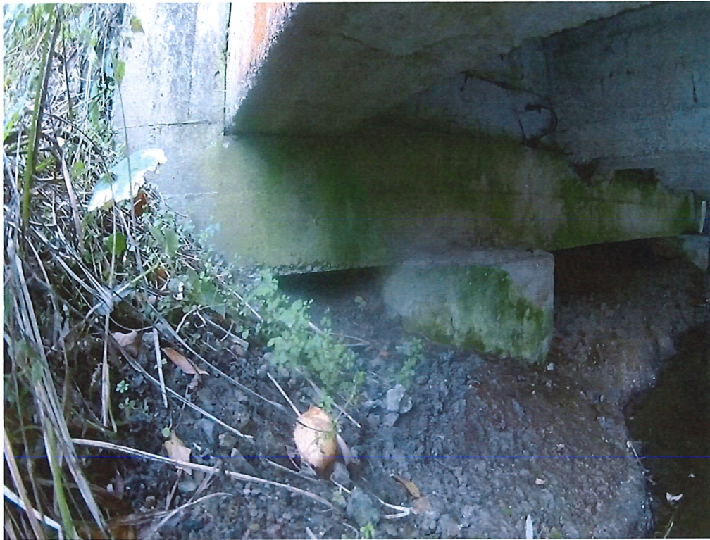
Fot. 3. Zwilgocenie jednej z ścian przyczółka