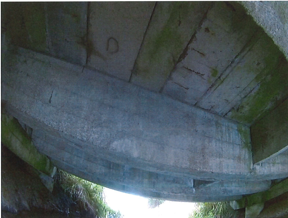
Fot. 4. Zwilgocenie, ubytki otuliny zbrojeniowej w płycie górnej