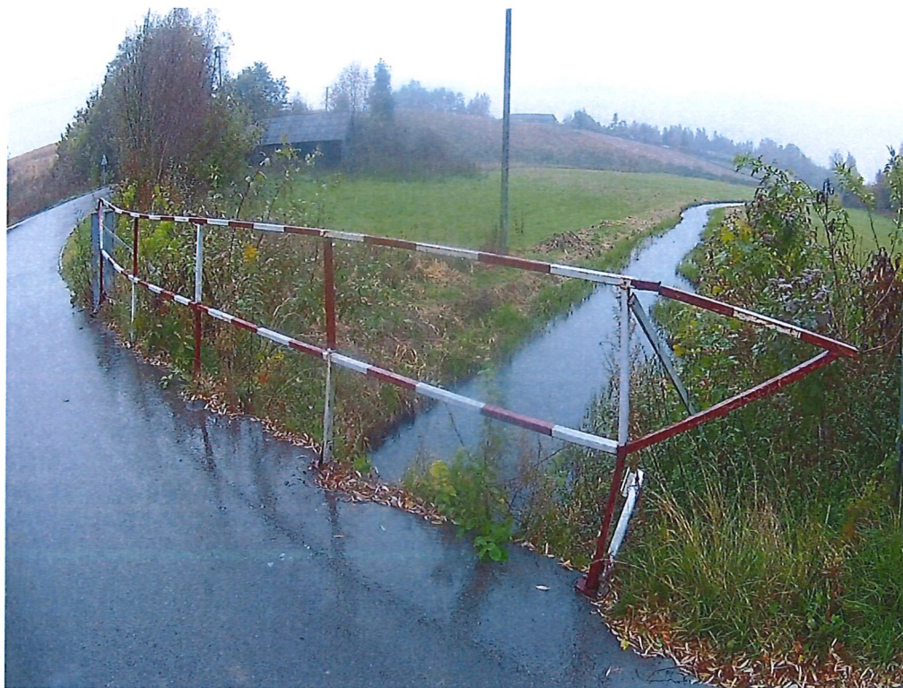
Fot. 2. Widok na barierę dla pieszych