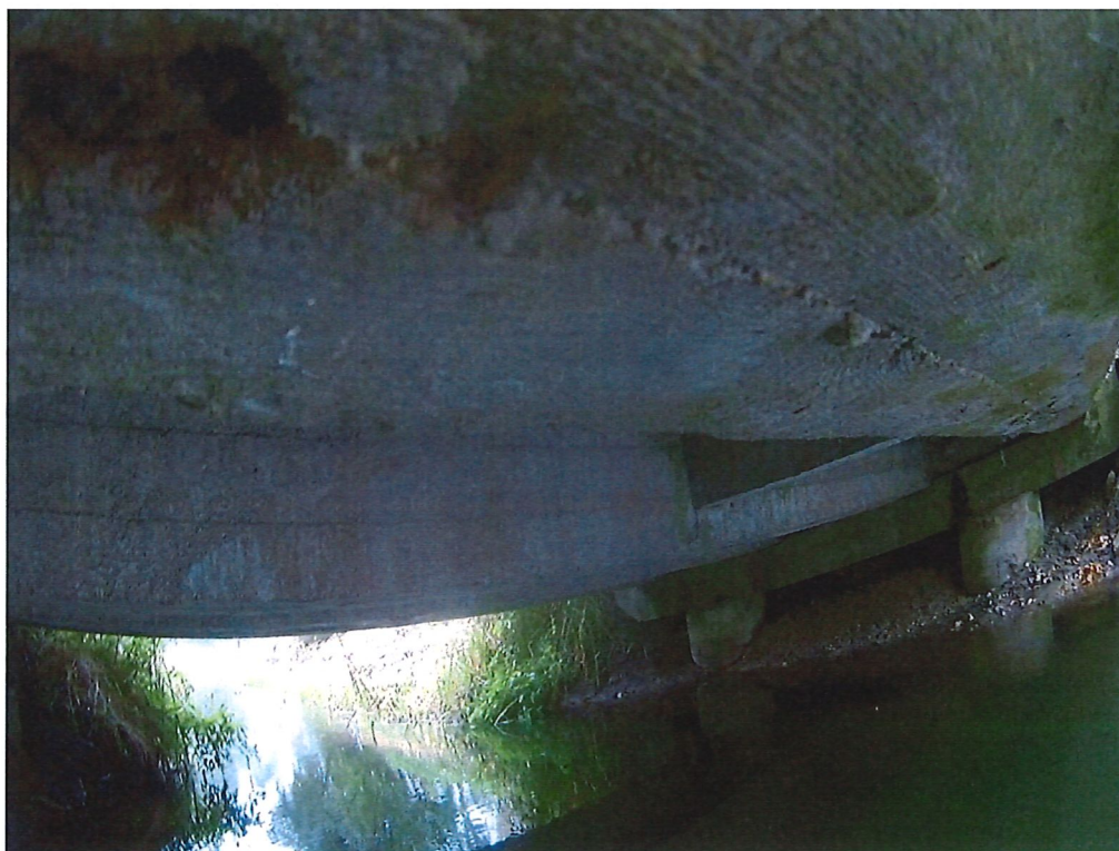
Fot. 4. Widok na most z perspektywy dolnej