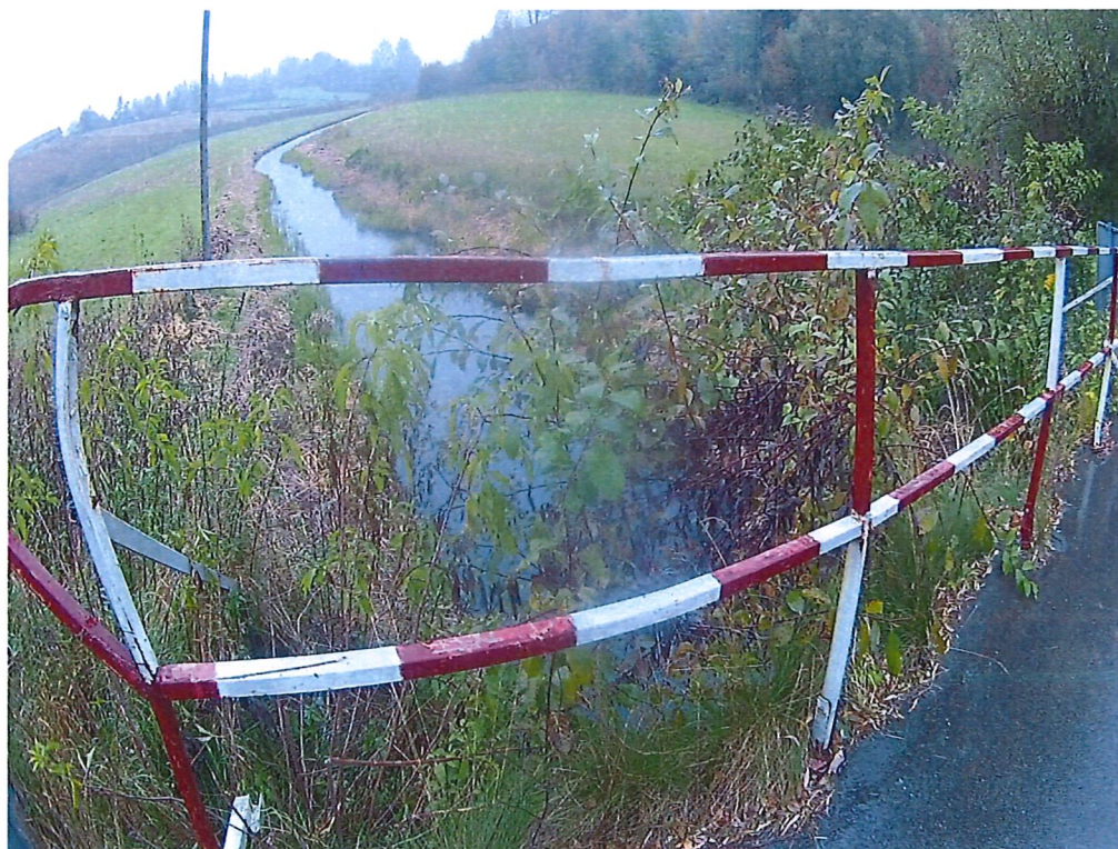
Fot. 2. Deformacja bariery dla pieszych