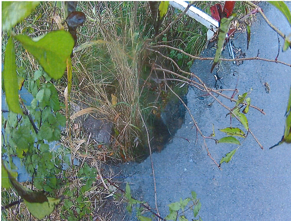
Fot. 1. Ubytek w nawierzchni drogi dojazdowej